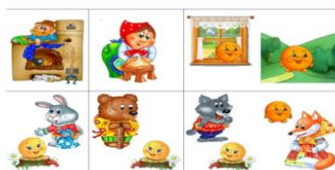
Переказ казки «Колобок»

- З чого був колобок? Скільки героїв? Що трапилося з колобком? Хто з'їв колобка?